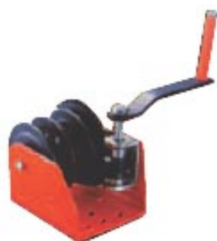
Art. Nr. 6015-026

Die Spiral-Werkstätte überprüft gerne Ihre Hebezeuge!